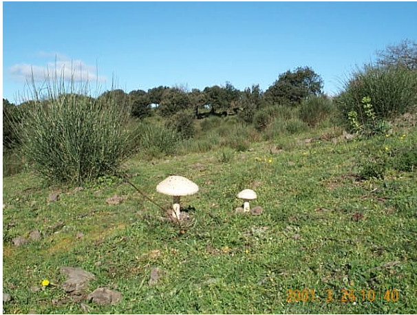
Azimut de la prise de vue : 340 gr